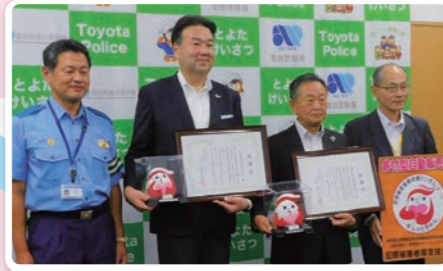
豊田建設業協同組合・太啓建設(株)