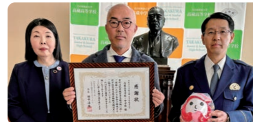
(学法)市邨学園名古屋経済大学 高蔵高等学校・中学校