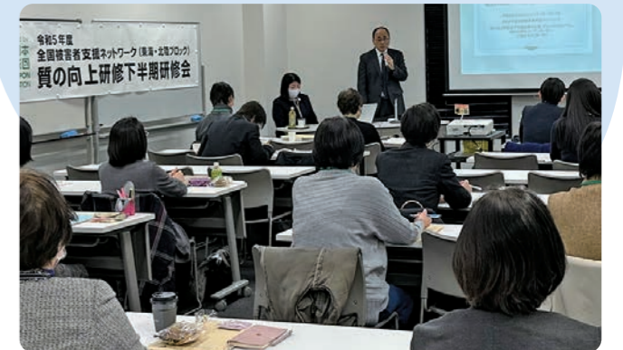
東海・北陸ブロック R6.3.2~3 ウィンクあい会議室

東海北陸6県から支援実績の基準を満たした支援員が受講しました。令和5年度は、あいポートが、担当県となり実施しました。相談技術や関係機関との連携のあり方などについて、ロールプレイなどを交えて、支援の実務を学び、その名の通り、支援の質の向上を図りました。