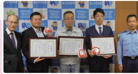
(株)インテラ・名阪急配(株)・(有)オガタ鉄工所