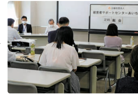
令和4年度 定時社員総会の様子

令和4年3月16日、臨時社員総会において、令和4年度事業計画、予算が、また、令和4年6月17日定時社員総会において、令和3年度事業報告、決算報告等が承認されました。また愛知県警察本部長と当センター会長連名で、長年の犯罪被害者支援に尽力した功労者への表彰が行われました。